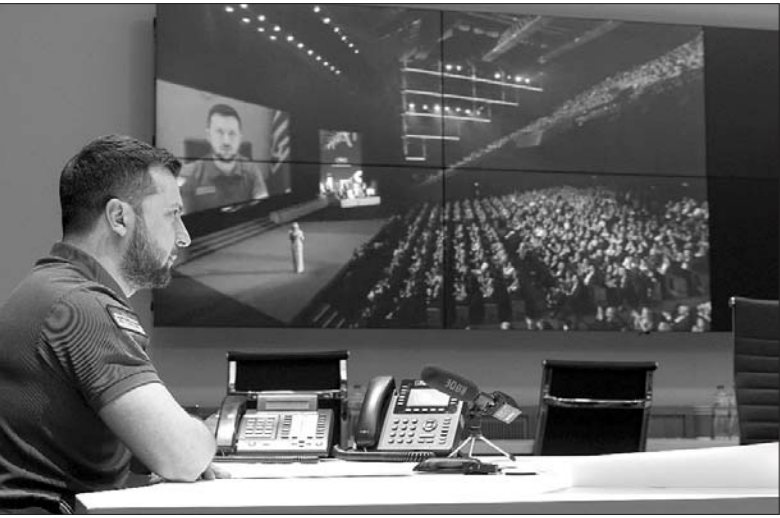
ПОЧАТОК НА 1-Й СТОР.

Тим часом Президент України продовжує виступати на різних міжнародних майданчиках, привертаючи увагу до війни, що триває в Україні.